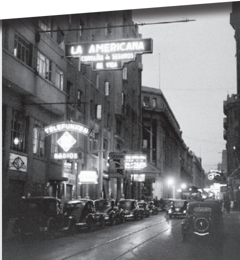
El Centro de Santiago, por su forma y ambiente, era el Nueva York chileno. Esta escena de un invernall atardecer en 1941 destaca por la gran cantidad de avisos luminosos que en esa época existía. En lo que a nosotros nos interesa, podemos identi car, estacionado a la derecha un Ford de 1935, con su repuesto en la tapa de la maleta. A la izquierda un Ford de 1929-30, un redondo Ford 1938-41, un tercer auto no identi cable y luego un Chevrolet cupó de 1941. Al centro, a lo lejos, se alcanza a divisar un tranvía. --- La Gaceta de los Clásicos .